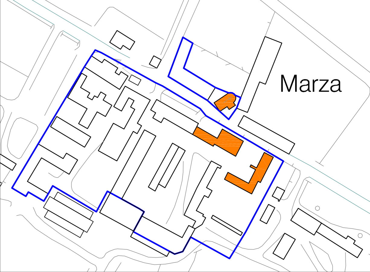
Cascina Marza scala 1:2.000